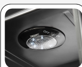
Lampe LED interne